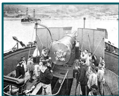
Barbette de l'Indomptable

Il est rayé des listes de la flotte le 3 août 1910 et sert de navire-dépôt à Rochefort de 1910 à 1914. En 1915, ses pièces de 274 mm sont démontées et installées sur affûts ferroviaires pour servir dans le secteur de Verdun.