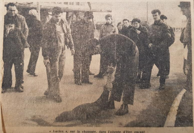
« Lucien », sur la chaussée, dans l'attente d'être encafé

“Lucien” le pinnipède a quitté les marais du Loch pour le centre zoologique du Ludré, près de Sarzeau