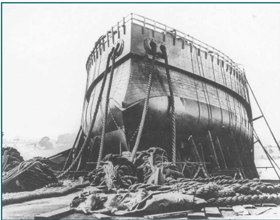
Indomptable à Lorient avant son lancement 1883

L'indomptable est mis sur cale le 15 décembre 1877 à Lorient. Sa construction durera 8 ans. Il est lancé de 18 septembre 1883.