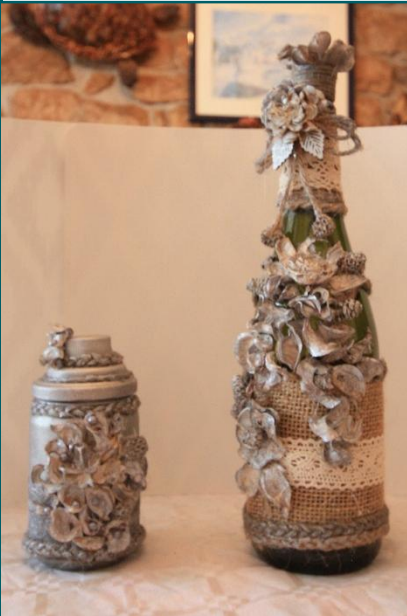
Lot N° 7 de 2 pièces : 20€