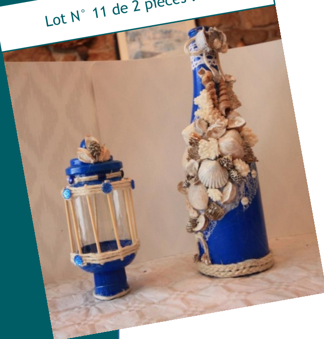
Lot N° 11 de 2 pièces : 20€