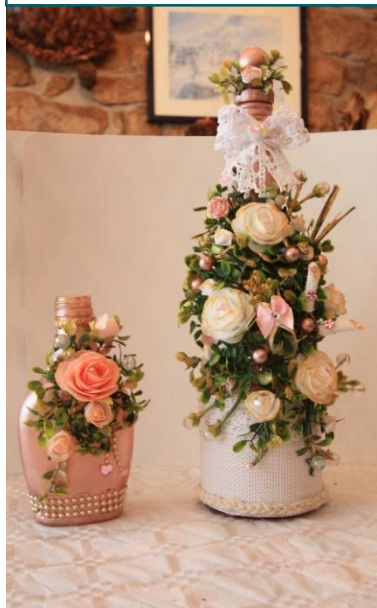
Lot N° 8 de 2 pièces : 20€