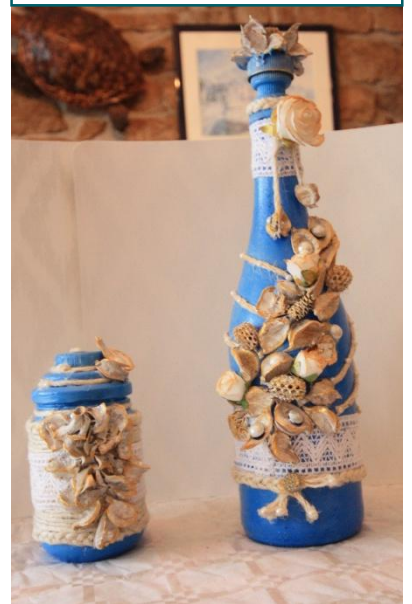
Lot N° 9 de 2 pièces : 20€