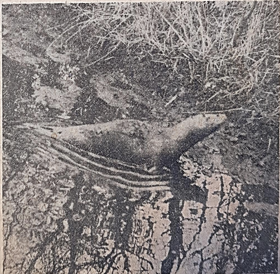
Par quelle aberration, le jeune phoque avait-il quitté le Loch pour s'aventurer dans un des fossés abominablement fangeux du marais ? C'est ici qu'il a été découvert.