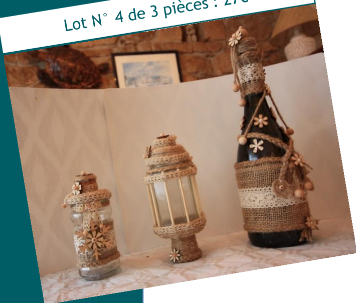
Lot N° 4 de 3 pièces : 27€